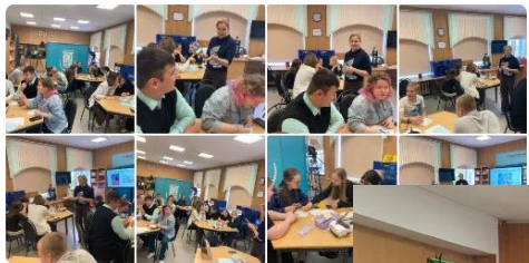
Фото Видео Клипы Мероприятия Обсуж