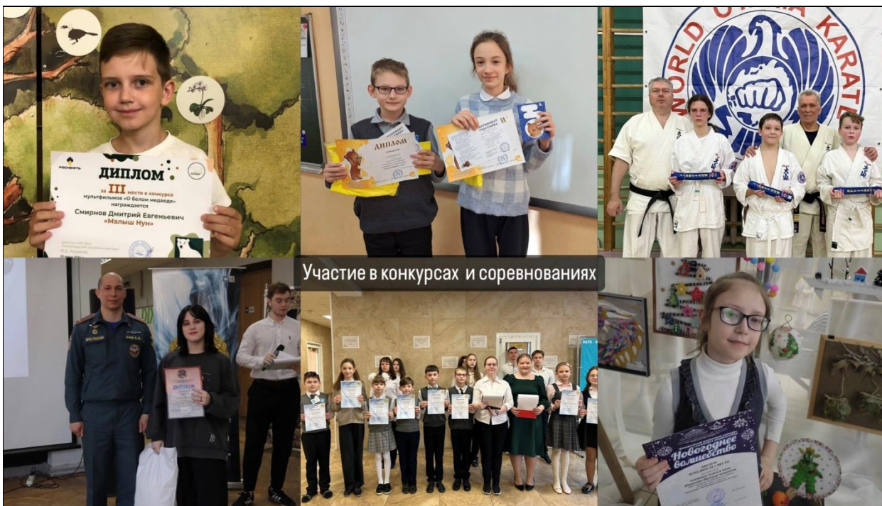
Участие в конкурсах и соревнованиях