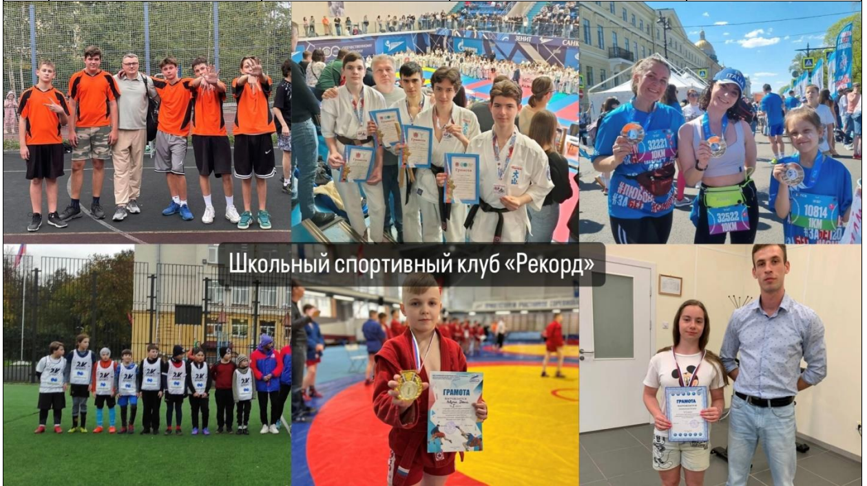
Школьный спортивный клуб «Рекорд»